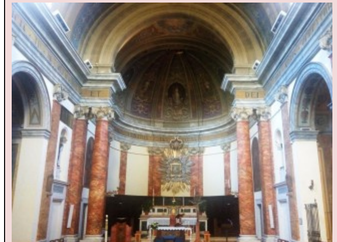
Chiesa di Santa Maria della Misericordia e Santuario Mariano Diocesano della Madonna delle Grazie - Cartoceto.

Sito internet: www.accademiadeitenebrosi.it Facebook: Cammini Francescani tra i due fiumi