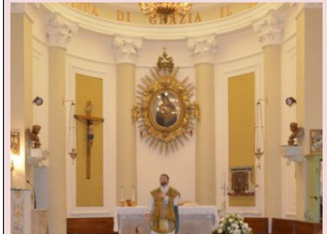
Chiesa di Santa Maria del Soccorso - Al centro esposizione della statua di San Filippo Neri protettore di Montemaggiore al Metauro

Sito internet: www.accademiadeitenebrosi.it Facebook: Cammini Francescani tra i due fiumi