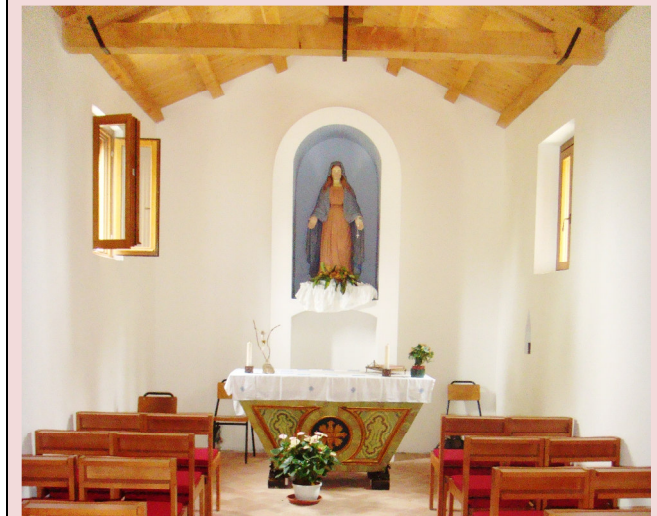
Interno Chiesetta della Madonna delle Grazie - Torre San Marco

Sito internet: www.accademiadeitenebrosi.it Facebook: Cammini Francescani tra i due fiumi